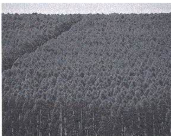
Em 2020, o estudo identificou registro de produção primária florestal em 4.868 municípios

Segundo o IBGE, a silvicultura ampliou sua participação no valor da produção primária florestal (99,8%) frente ao extrativismo vegetal (loresta de produtos em matas e florestas nativas), que passou a responder por 20,2% desse